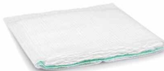
Zetuvit plus är ett fyrlagers förband.

I djupa sår kan Zetuvit plus kombineras med Sorbalgon och PermaFoam cavity.