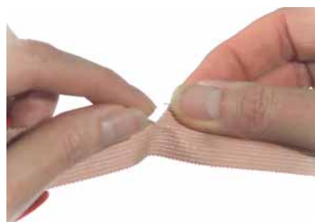
Så här river du Omniplast på rätt sätt.