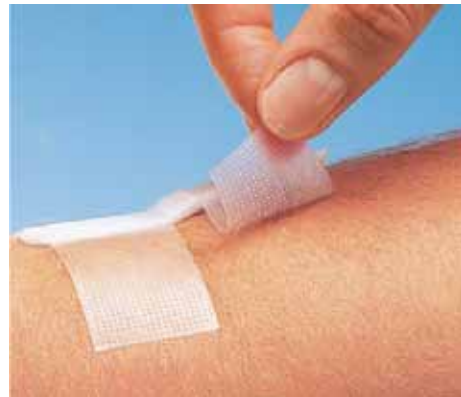
Omnifilm har häftmassan applicerad i strängar.

Huden måste vara torr vid fixering av tejp.