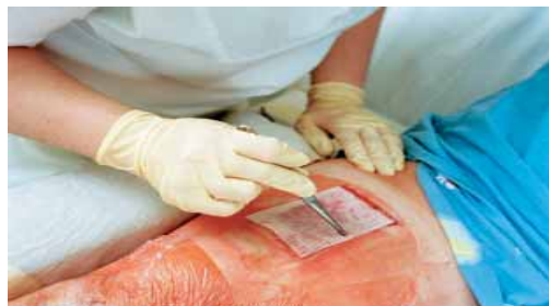
Applicering av Hydrotul på tagställe.

Produkten är klassificerad som medicinteknisk produkt, klass IIb, steril. CE-märkt enligt EU-direktiv 93/42/EWG.