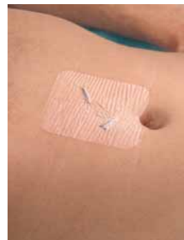
Hydrofilm skyddar suturer och suturtejp mot väta.